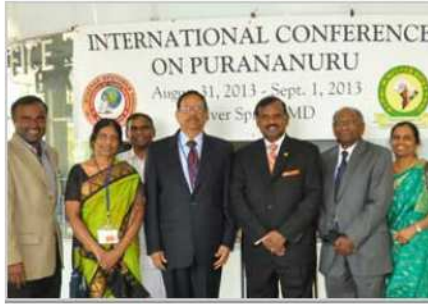
View More Photo

வாசிங்டன்: வாசிங்டன் வட்டாரத் தமிழ்ச்சங்கம், வட அமெரிக்கத் தமிழ்ச்சங்கப் பேரவையுடன் இணைந்து "புறநானூறு பன்னாட்டு மாநாடு" ஒன்றை நடத்தியது. வாசிங்டன் வட்டாரத்தில், மேரிலாந்து மாநிலத்தில் சில்வர் ஸ்ப்ரிங் என்ற ஊரில் இரண்டு நாட்களாக நடந்த இந்த மாநாடு, முழுக்க முழுக்க புறநானூற்றை அலசி, ஆராய்ந்து, ரசித்து, விவாதிக்கும் ஓர் அரிய வாய்ப்பாக அனைவருக்கும் அமைந்தது. அமெரிக்காவின் பல பகுதிகளிலிருந்தும், கனடாவிலிருந்தும் தமிழகத்திலிருந்தும் சுமார் 350-க்கும் மேற்பட்டவர்கள் இந்த மாநாட்டில் கலந்து கொண்டனர்.